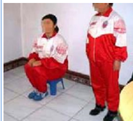
酷刑演示：罚坐小板凳