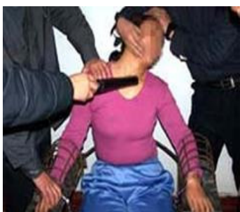
■中共酷刑图：电棍电击