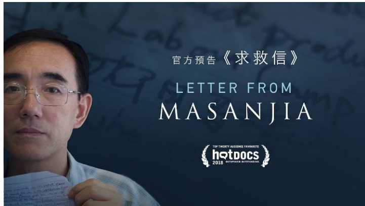
▲纪录片《求救信》的官方中文版预告片。

求救信是向地球的另一端发出请求帮助的呼吁。墨西哥纪录片电影节的宗旨是“给那些没有被人听到