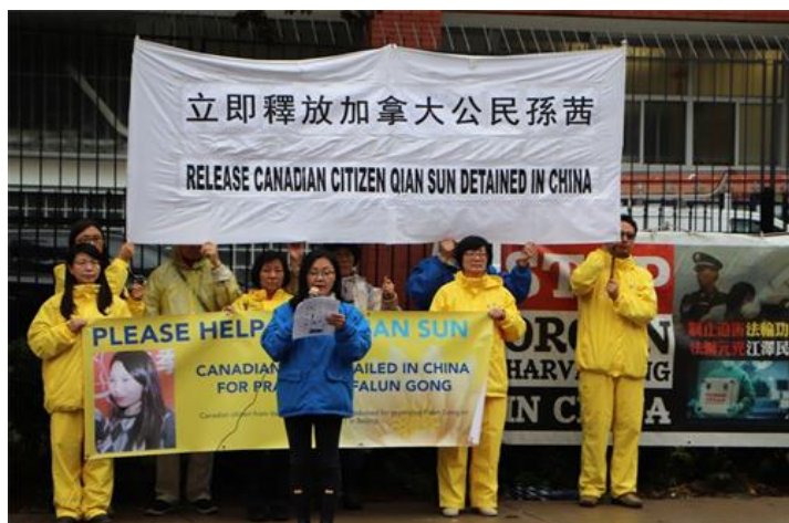
▲多伦多法轮功学员在中领馆前召开新闻发布会