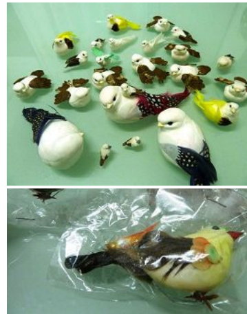
■ 吉林省女子劳教所的毒活奴工产品

轮功学员做很多手工活，包括：日本歌姬样式的小人，都是穿各种服饰拿着一把小伞的；用羽毛粘蝴蝶翅膀；用白色的泡沫压缩成的小鸟，再往小鸟身上涂上乳