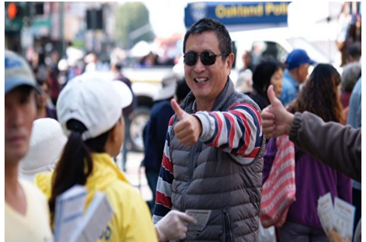
▲ 중국인이 '파룬따파하오(法輪大法好)'라고 한다

진상을 요해하는 민중들로 붐볐다. 현지 일부분 파룬궁수련생들은 해마다 이 거리축제에 참가해 현지 대중들에게 파룬궁과 파룬궁진상을 소개했다. 여러 해 꾸준히 노력했기에 많은 사람들은 이미 진상을 알게 됐다. 어떤 사람들은 부스 앞에와 주동적으로 수련생과 열정적으로 인사했으며, 어떤 사람은 엄지손가락을 세우면서 수련생들이 대단하다고 칭찬했다. 이틀간 249 명의 중국인이 삼퇴(중국공산당 당, 단, 대에서 탈퇴)했다.