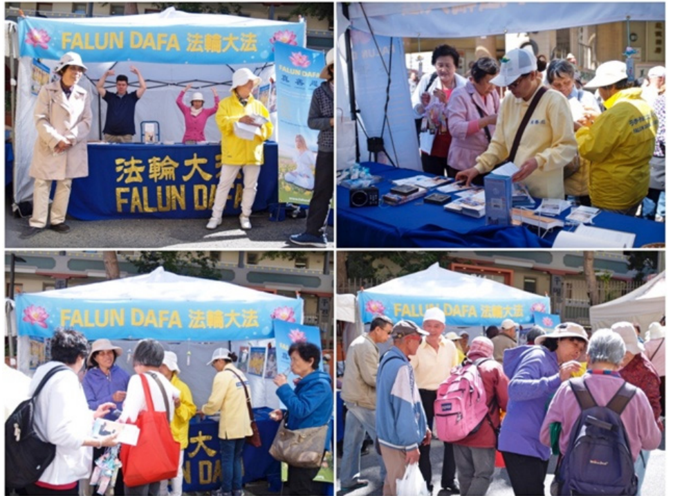
▲旧金山华埠中秋街会上，法轮功学员的摊位前游客很多。

一位六十多岁的中年男士来到摊位与学员攀谈良久。他告诉学员自己以前是黑五类，什么都没入过，共