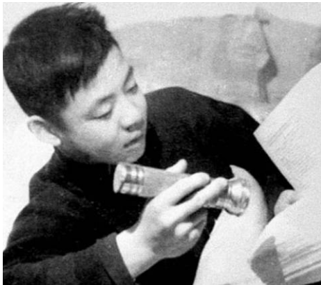
■ 雷锋大白天用手电筒看书的照片

被中共骗了几十年，不是中国人不聪明，是中共有系统地对中国人洗脑灌输。可惜，“一代被骗的中国人死去了，另一代中国人继续对中共谎言着迷，这是中国人最大的悲哀，也是中华民族的大不幸。”（摘自《九评共产党》）