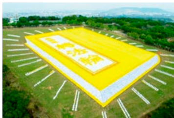
◎ 6000 多名法轮功学员排出《转法轮》一书模型，将这巨著展现在宝岛台湾的大地上。

在《转法轮》出版至今的二十四年间，包括中国大陆在内的 100 多个国家和地区一亿多不同族裔的民众，通过阅读不同文种的《转法轮》走进了法轮大法修炼，身心受益。不读《转法轮》，人生有缺憾，这是无数修炼法轮大法的民众的肺腑之言。