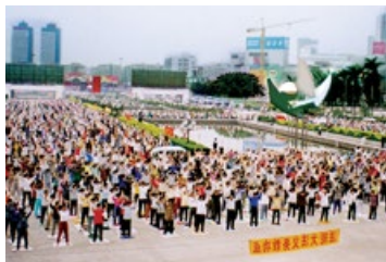
◎ 1998 年，广州一个炼功点的法轮功学员在炼功。1999 年广州有近 25 万人修炼法轮功。