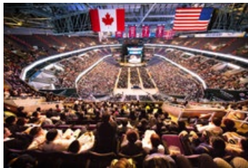
◎ 来自 56 个国家的上万名法轮功学员，于 2018 年 6 月齐聚华盛顿召开修炼心得交流会。