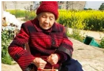
◎ 107 岁的老太太，因修炼法轮功身心得以康乐。老人说：是法轮功延长了我的寿命。