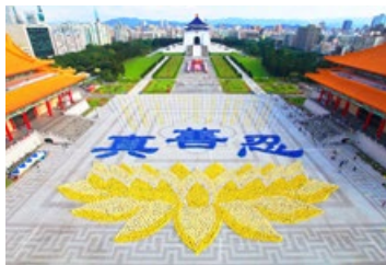
◎ 5000 多名法轮功学员在台北自由广场，排出立体莲花图形和“真善忍”三个大字。

女儿带来了李洪志师父的讲法录音带。老太太一遍一遍地听，感觉讲得真好啊，句句都说到她心里去了。活这么大岁数，还从来没有听到过这样的话呢，心里那个舒坦啊！老太太当天下午身体就好转了，可以喝稀饭了，第二天就站起来走路了。老太太说：我从小没有上过学，也不识字，就这样一直听师父的讲法录音，坚持炼功，身体好得很，还能干家务活，再没得过病，至今已经 15 年了，亲人们都由衷地感恩法轮大法。