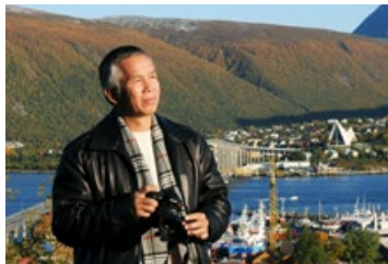
◎ 李建辉赋诗：漫漫长夜苦难中，迷茫寻觅心交瘁。幸遇师尊得大法，离家久远终回归。