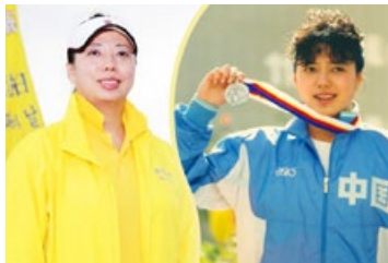
◎ 前奥运名将黄晓敏说：“真善忍”的精神，让她感觉如同身心再造，生命充满了活力。