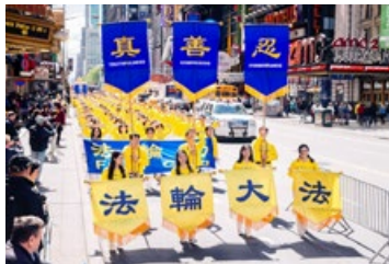
◎ 2017 年 5 月，来自世界各地的法轮功学员在美国纽约举行盛大游行，吸引了众多游客驻足。