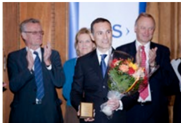
◎ 瑞典国王奖获奖者瓦西柳斯说：如果我不修炼法轮功，绝对不能胜任今天的工作。