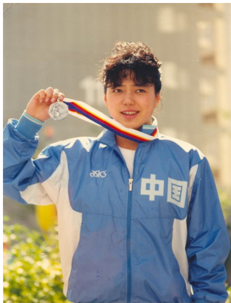
■前奥运名将黄晓敏档案照

黄晓敏，曾是叱咤世界泳坛的名将，在八十年代那是家喻户晓，尽人皆知。在全国乃至世界各类比赛中获得奖牌无数，曾实现了中国队在奥运游泳项目中奖牌零的突破。可是令人痛心的是，由于长期的强化训练，退役后她几乎全身瘫痪，度过了一段痛苦、绝望的日子。如今，她又健康的