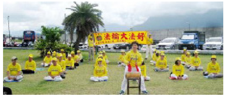
화롄 파룬궁 수련생이 치싱탄에서 당고를 연주하고 있다.

파룬궁 수련생이 대륙에서 온 천 선생에게 ‘3퇴(퇴당, 퇴단, 퇴대)’를 권하자 그가 말했다. “어려서 정말 장난이 심했는데, 5학년이 됐을 때 선생님이 붉은 스카프를 안 매줘서 마음속으로 불만을 가졌습니다. 하지만 커서 공산당이 하는 짓을 보고는 제가 중공의 어떤 조직에도 가입하지 않은 것이 정말 다행스러웠습니다. 제 친구 하나는 모 부문에서 일합니다. 어느 날 집에서 독립제작자의 기록 영상을 봤는데, 다음날 면담실에 불려가서 왜 그런 영상을 봤느냐고 추궁을 당했습니다. 중국 대륙은 인권이 없고, 언론 자유가 없고, 웨이신 내