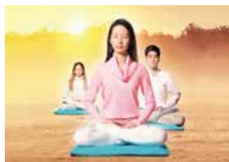
◎ 玛格丽特博士经多年临床试验，出版《法轮功的正念实践》，探究法轮功健身奇效。