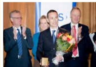
◎ 瑞典国王颁奖者瓦西柳斯说：如果我不修炼法轮功，绝对不能胜任今天的工作。