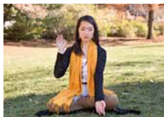
◎ 依力修炼法轮功至今已 20 年了，读《转法轮》和炼功是她生活不可或缺的一部分。