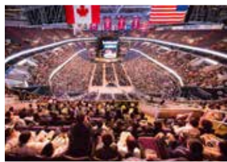
© 来自 56 个国家上万名法轮功学员，于 2018 年 6 月齐聚华盛顿召开修炼心得交流会。