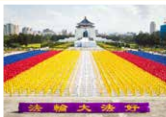
◎ 台湾 6000 多名法轮功学员齐聚自由广场集体炼功。台湾修炼法轮功人数达 50 万人。

从此以后，面对婆婆对自己的不断责骂，面对婆婆对年幼女儿的极端冷漠，秀贞以法轮功“真、善、忍”的标准要求自己，事事为患有严重抑郁症的婆婆考虑，细心照顾她，终于解开了婆媳之间错综复杂的矛盾、怨恨和纠结。婆媳俩从貌合神离的表面亲和，最终走到倾听心事，无所不谈，情同母女的融洽，让邻居亲戚都羡慕不已。秀贞说：“如果不修炼法轮功，我绝对做不到这样，说不定比婆婆的抑郁症还要重。”