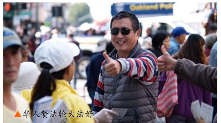
▲华人赞法轮大法好