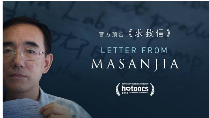
▲纪录片《求救信》的官方中文版预告片。

求救信是向地球的另一端发出请求帮助的呼吁。墨西哥纪录片电影节的宗旨是“给那些没有被人听到