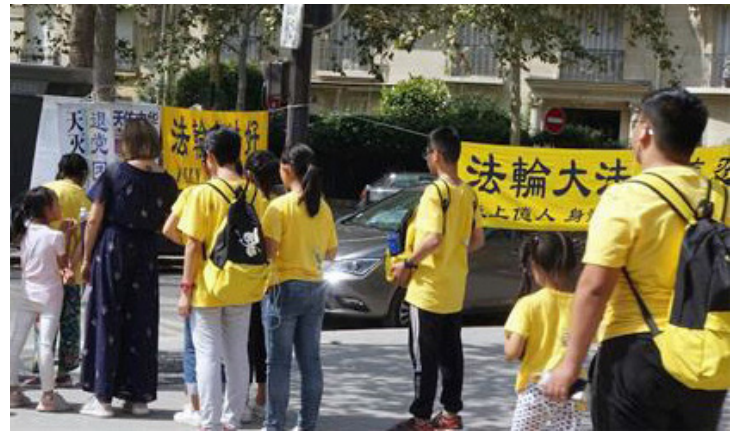
대륙 학생 여행단이 파룬궁 진상 전시판을 보고 있다.

한 젊은이는 대륙에서 독일로 온 중국 유학생이었다. 그는 파룬궁 전시판 앞에서 파룬궁 수련생과 대화를 나눈 후 자신이 이전에 들은 것이 모두 부정적인 것들이라며, 오늘 이렇게 유명한 에펠탑에