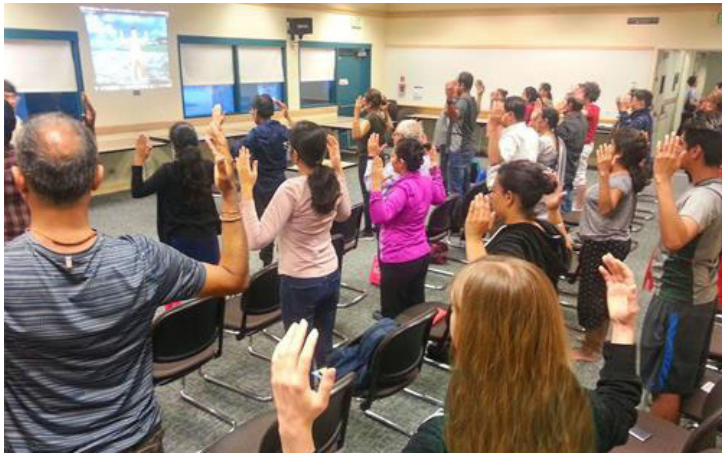
신 수련생이 파룬궁 2장 공법을 배우고 있다.

내 말을 들은 아가씨는 남편과 함께 즉시 '3퇴'했고, “파룬따파 하오, 찌싼런 하오”를 정성껏 외웠다. 5년이 지난 지금 아가씨의 남편은 건강을 회복했고, 여전히 잘 살고 있다.