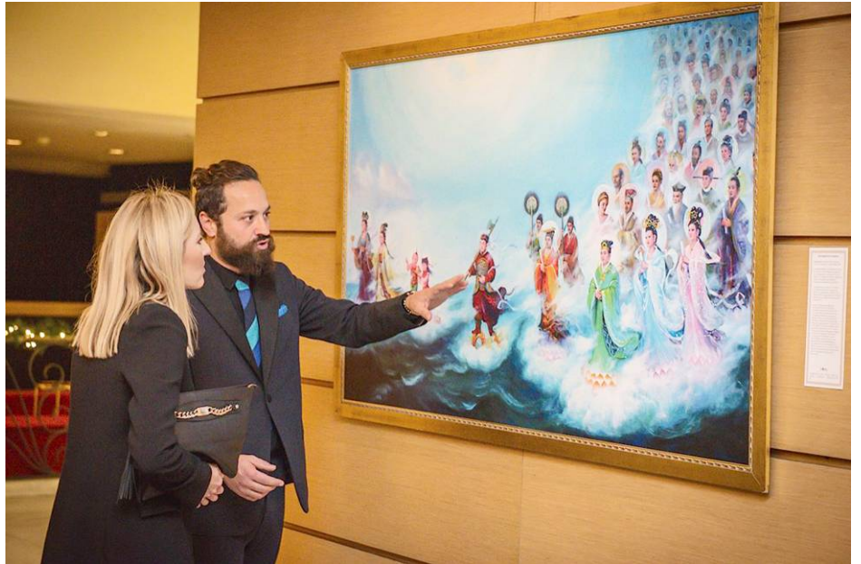
▲法轮功学员在艺术展上为参观者讲解画作《誓约》。