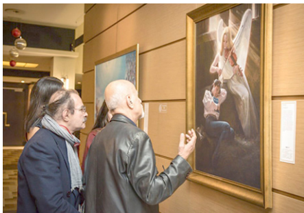
▲著名画家阿格罗斯（右）和迪米特里斯·瓦尔瓦雷索斯（左）在艺术展上欣赏画作《流离失所》。

另一位著名画家迪米特里斯·瓦尔瓦雷索斯（Dimitris Varvaresos），在看到其中一幅画作——小女孩抱着父母的骨灰泪流满面时，他说：这些艺术家从神圣中获取灵感。