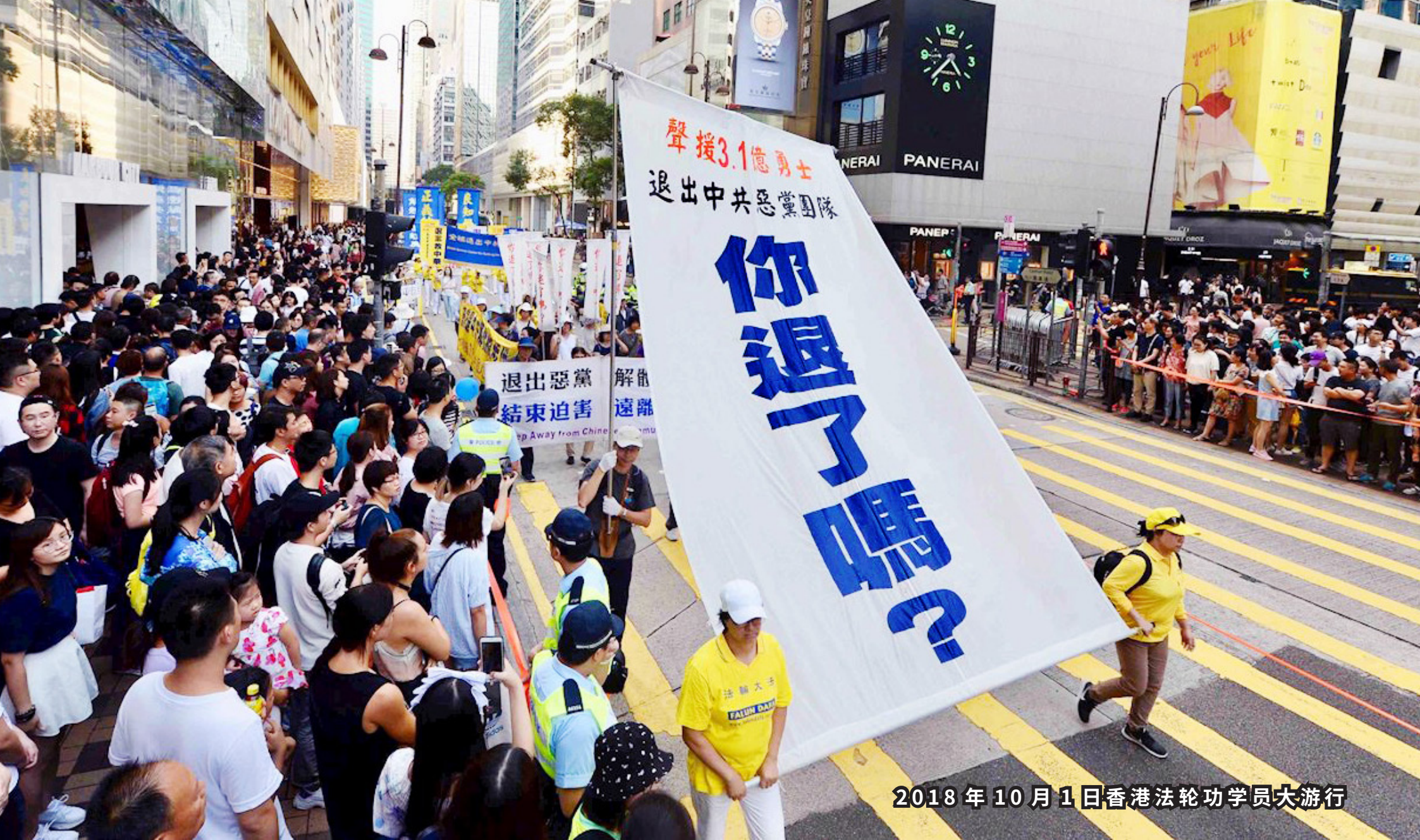
2018年10月1日香港法轮功学员大游行