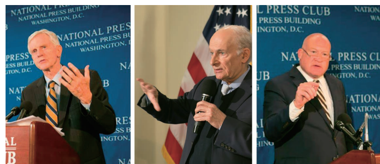
大卫·乔高 大卫·麦塔斯 伊森·葛特曼

2016 年 6 月 22 日，加拿大著名律师大卫·麦塔斯、加拿大前亚太司司长大卫·乔高和美国资深调查记者伊森·葛特曼，联合发布中共强