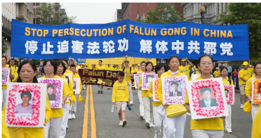
▲二零一八年六月二十日，来自不同国家的六千多名法轮功学员在美国首都华盛顿 DC 举行反迫害集会游行，要求国际社会制止中共对法轮功持续十九年的残酷迫害。图为现场悼念被中共迫害致死的法轮功学员（已获得确认 4275 人）的游行方阵。

大安市政法轮功学员吕日昭因坚持修炼，被绑架到九台市饮马河劳教所劳教三年，期间被无数次强制洗脑，不让睡觉，强迫看攻击大法的录像，强制转化洗脑等等。出狱回家时已经神志不清。◇