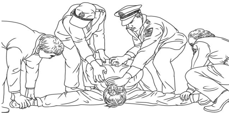
◀ 中共酷刑示意图： 劈腿

二零一七年冬天大寒时节，因陶金龙不理睬王甫琛的恶意盘问，王甫琛就往陶金龙衣领里大灌刺骨的冰水，冻得陶金龙心脏病发作；换了衣服后又又被王甫琛泼上冰水，心脏急剧恶化，被送医院抢救。王甫琛还吐口水到陶金龙饭菜里，逼陶金龙吃下去。◇