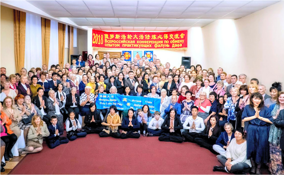
▲2018年10月10日，参加“俄罗斯法轮大法修炼心得交流会”的部分法轮功学员。

1995年3月13日，法轮功创始人李洪志先生应中国驻法国大使馆邀请，在中使馆文化处举行讲法报告会；同年，李洪志先生应邀前往瑞典，在瑞典海滨城市哥德堡举办7天海外法轮功面授学习班。至此，法轮大法开始传入欧洲，弘传海外。