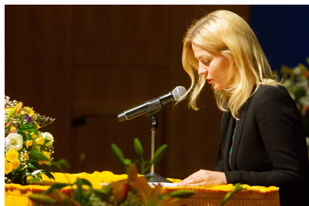
▲心得交流会现场和分享修炼心得体会的西方法轮功学员。