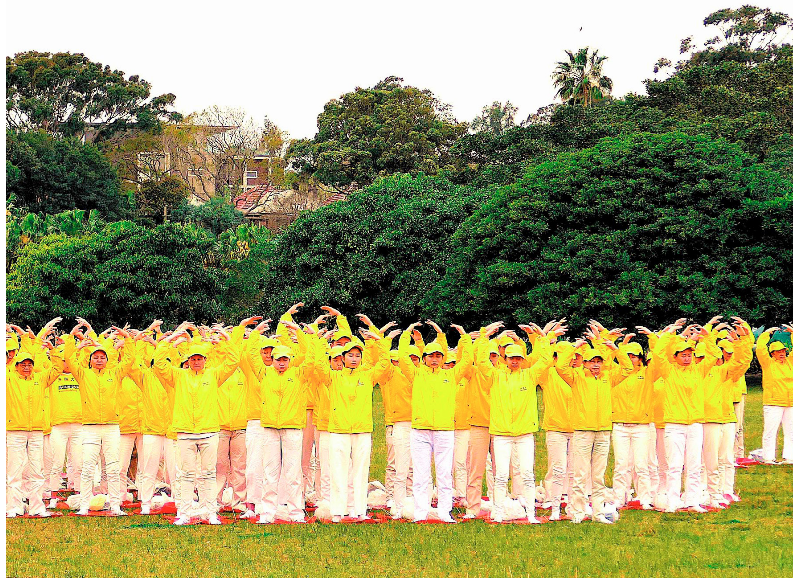
2018年9月8日周六清晨，悉尼水边公园的草地上，晶莹的水珠顺着细长的草叶静静滑下——来自全澳不同城市的部分法轮功学员约500人，身穿明亮的黄色炼功服在集体炼功，场面宁静祥和，殊胜。