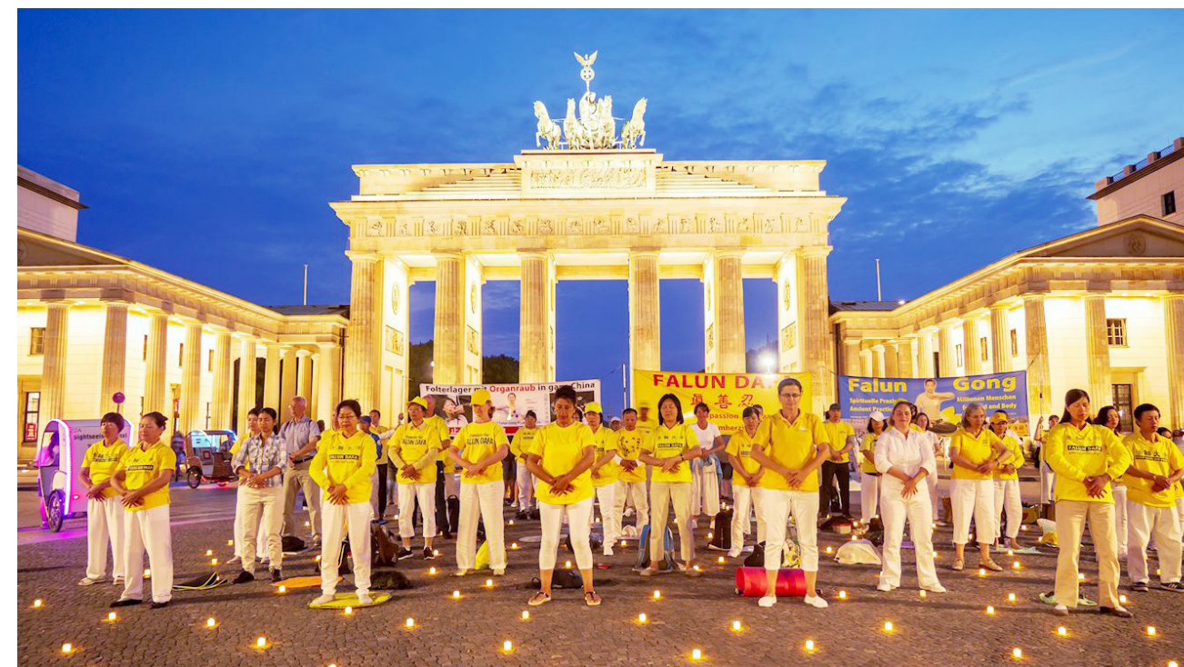
▲ 2018 年 7 月 26 日，德国法轮功学员在柏林勃兰登堡门前广场集体炼功。