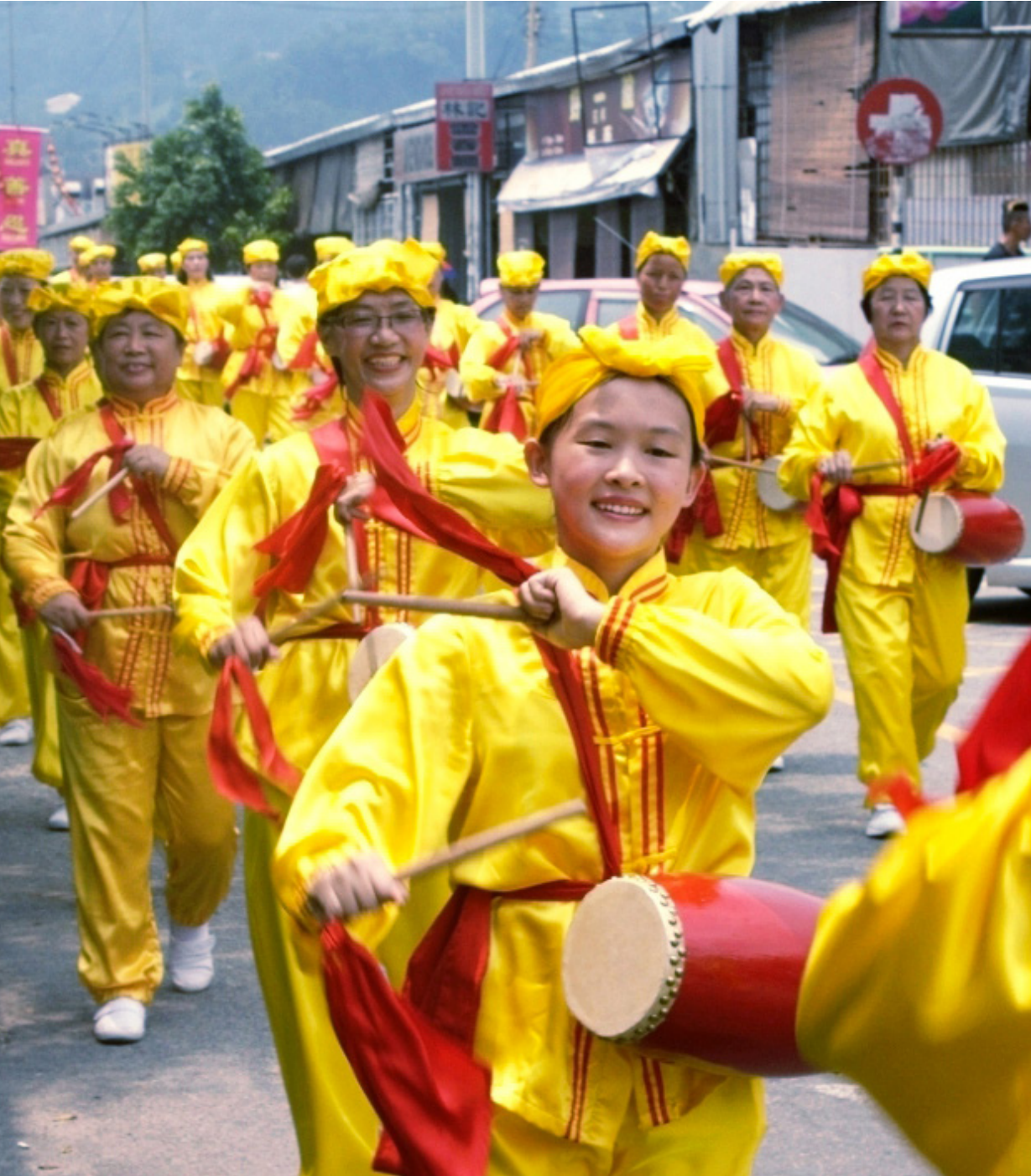
马来西亚法轮功学员，在雪兰莪州安邦太子园（Taman Muda Ampang）举行大游行庆典活动。游行队伍中，婀娜多姿的仙童仙女队、威风凛凛的舞龙队、充满喜庆的腰鼓，给世人带来了喜悦和祝福。