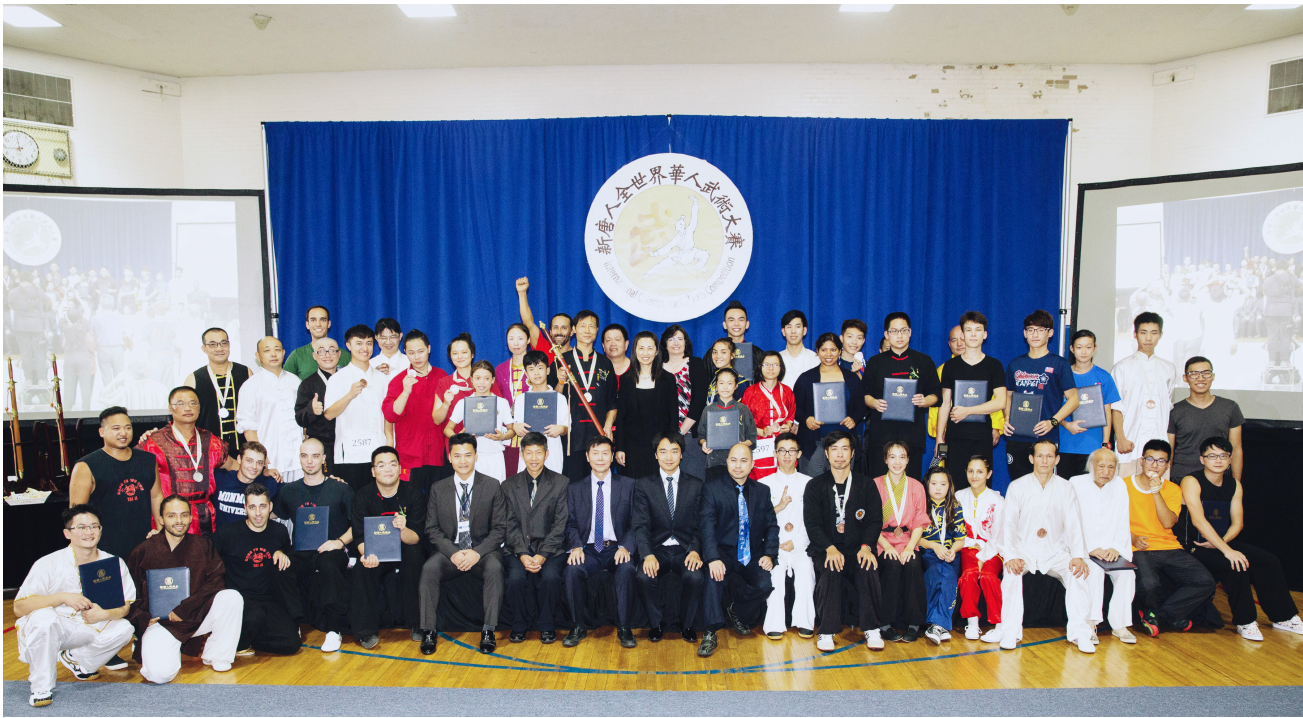
▲ 2016 年 9 月 18 日，第五届“新唐人全世界华人武术大赛”圆满结束，颁奖典礼后全体获奖选手与大赛评委合影留念。前排右起第 12 位为大赛评委会主席李有甫。

人工受孕，两次都失败了。后来他们慕名找到李有甫。李有甫跟他们解释说：母亲就好比土壤，要让种子发芽就需要合适的阳光水分营养等成分，要按自然规律来调理人体机能，不能强行硬用试管婴儿的外在办法。这对美国夫妻接受李有甫的建议后，经过几个月的调理，她就怀孕了。孩子出生后，长得非常漂亮。