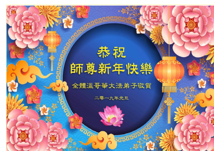
温哥华全体大法弟子恭祝师尊新年快乐