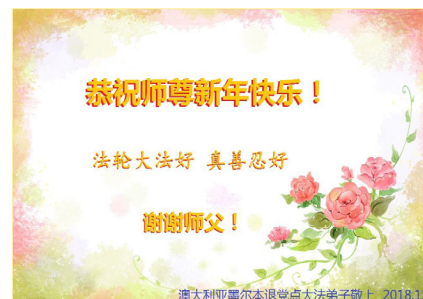
澳大利亚墨尔本退党点大法弟子恭祝师尊新年快乐