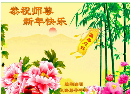
中国胜利油田大法弟子恭祝师尊新年快乐