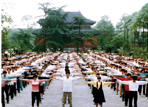
图：1999年7月20日前，四川省成都市的部分法轮功学员在晨炼。

他们的面子，勉强同意去炼功点。那时她虚弱得走不了路，是被大家抬去的。到那儿，看到大家都站着在炼功，一会儿就开始打坐，她坐在中间看着。打坐结束了，大家来扶她，奇怪的是，她竟然可以自己拄着拐杖走路，而且还可以边走边和他们交谈。