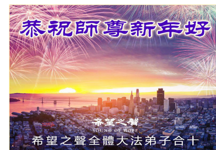
希望之声全体大法弟子恭祝师尊新年好