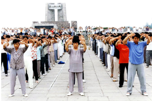
图：1999年7月20日前，河北唐山数千名法轮功学员在纪念碑广场集体炼功。

听到“真、善、忍”的“忍”字，我心中一动，脱口而说：“哎，这个‘忍’可太好啊，不生气了，就不得病了嘛！气煞人哪！”我这么叨咕着，就觉得摔坏的左髋骨处“唰唰唰”地有东西在转，就像有人往下揭一块紧箍的大铁嘎巴一样，特别舒服！简直没法用语言形容！在炼功场上，我还没炼功呢，已经感觉师父在给我调整身体，明显感觉法轮在我身上旋转了