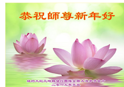
纽约大纪元时报发行团队全体大法弟子的敬贺