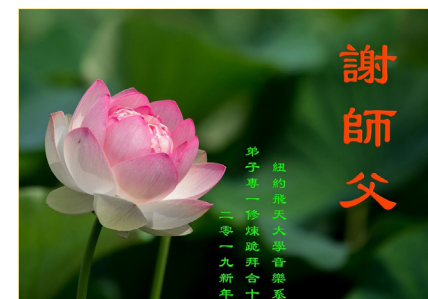
纽约飞天大学音乐系大法弟子敬谢师尊