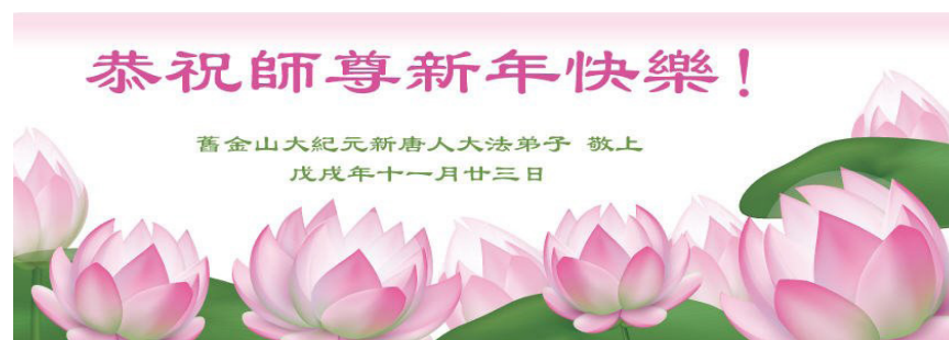
旧金山大纪元新唐人大法弟子恭祝师尊新年快乐