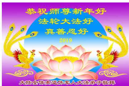
大陆全体离退休军人大法弟子敬拜

新年到来之际，全球各族裔法轮功学员及各界民众，尤其是中国大陆各地区、各阶层、各行业的法轮功学员和明白真相的民众，纷纷将如雪片般的贺卡、贺词以及视频发往明慧网，表达对李洪志师父最诚挚的感恩与新年问候。