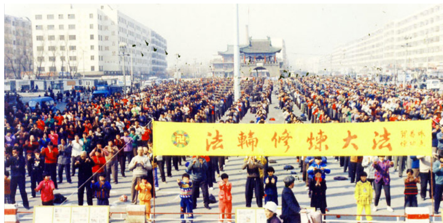
图：1999年5月黑龙江双城市法轮功学员在东门广场集体炼功