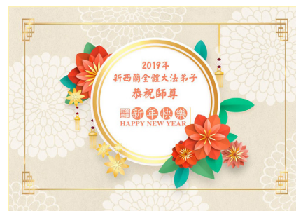
新西兰全体大法弟子恭祝师尊新年快乐