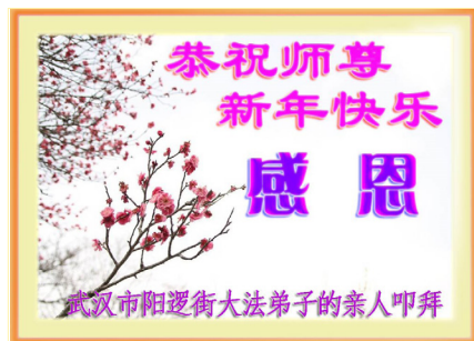
武汉市阳逻街大法弟子亲人的感恩