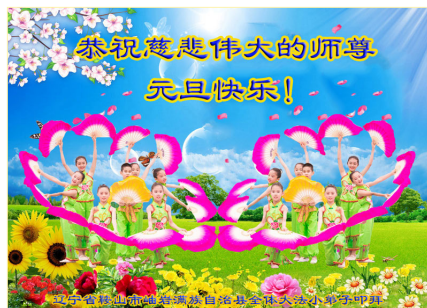
辽宁省鞍山市岫岩满族自治县大法小弟子叩拜