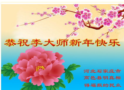
河北石家庄市高邑县明真相得福报的民众敬贺