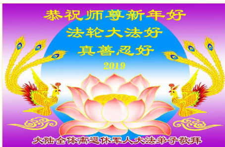
大陆全体离退休军人大法弟子敬拜

新年到来之际，全球各族裔法轮功学员及各界民众，尤其是中国大陆各地区、各阶层、各行业的法轮功学员和明白真相的民众，纷纷将如雪片般的贺卡、贺词以及视频发往明慧网，表达对李洪志师父最诚挚的感恩与新年问候。