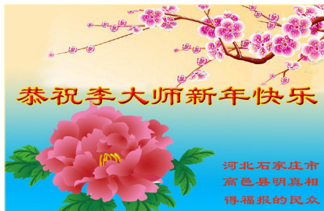
河北石家庄市高邑县明真相得福报的民众敬贺