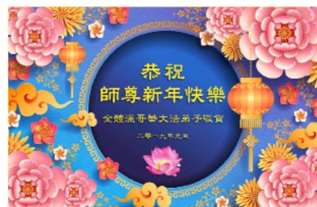
加拿大温哥华全体大法弟子恭祝师尊新年快乐