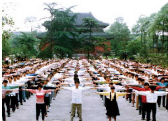
图：1999年7月20日前，四川省成都市的部分法轮功学员在晨炼。

几天后，学生又来了，朋友也一再劝说，她不好意思扫他们的面子，勉强同意去炼功点。那