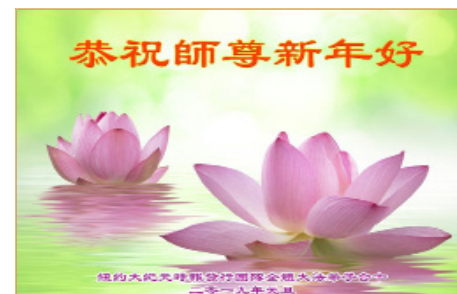
纽约大纪元时报发行团队全体大法弟子的敬贺