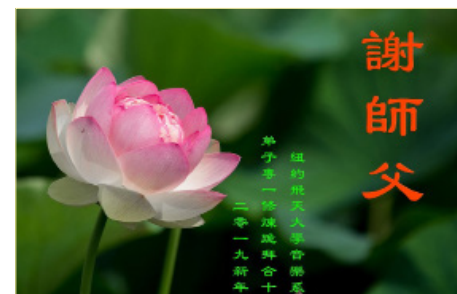
纽约飞天大学音乐系大法弟子敬谢师尊