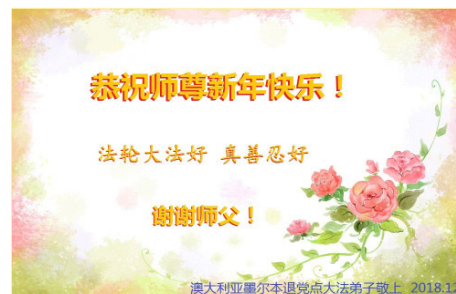
澳大利亚墨尔本退党点大法弟子敬上 2018.12