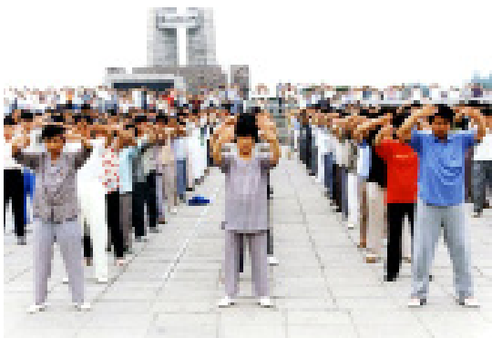
图：1999年7月20日前，河北唐山数千名法轮功学员在纪念碑广场集体炼功。

听到“真、善、忍”的“忍”字，我心中一动，脱口而说：“哎，这个‘忍’可太好了，不生气了，就不得病了嘛！气煞人哪！”我这么叨咕着，就觉得摔坏的左髌骨处“唰唰唰”地有东西在转，就像有人往下揭一块紧箍的大铁嘎巴一样，特别舒服！简直没法用语言形容！在炼功场上，我还没炼功呢，已经感觉师父在给我调整身体，明显感觉法轮在我身上旋转了7次，我的腰好了，能直起来了，真是太神奇了！