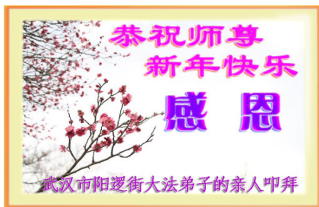
武汉市阳逻街大法弟子亲人的感恩