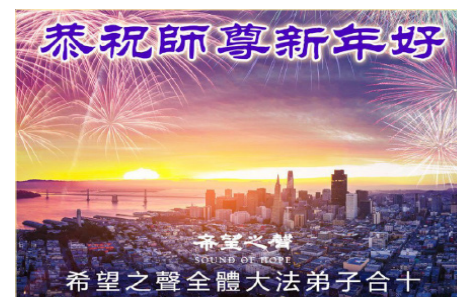
希望之声全体大法弟子恭祝师尊新年好