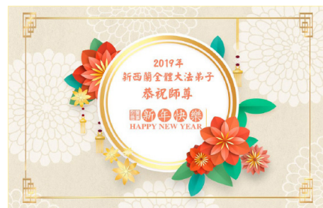
新西兰全体大法弟子恭祝师尊新年快乐