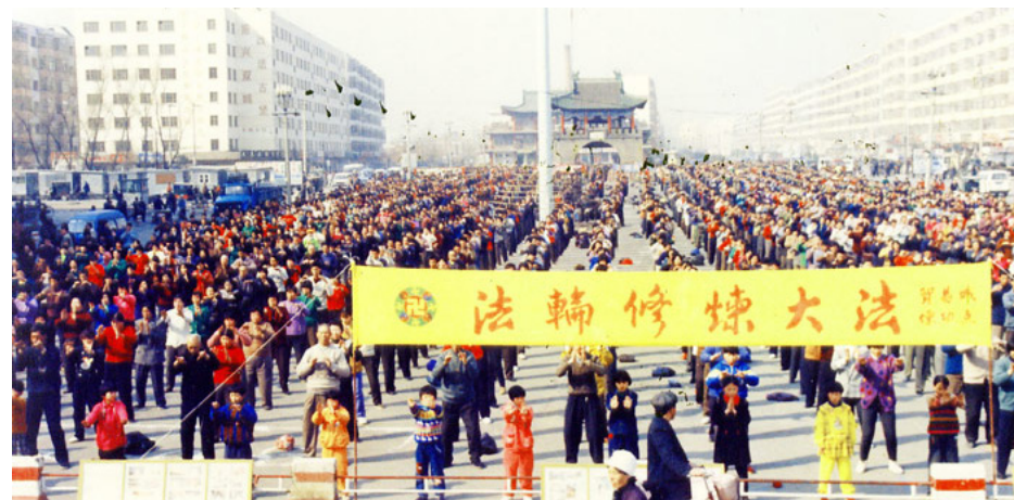
图：1999年5月黑龙江双城市法轮功学员在东门广场集体炼功