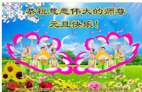
辽宁省鞍山市岫岩满族自治县大法小弟子叩拜