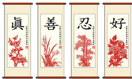
▲激光雕刻剪纸真善忍好

这时，车头前方有人朝我喊：“小伙子，请过来！”我扭头看去，原来是几位乘客同时叫我过去。他们说：“小伙子，你是个好