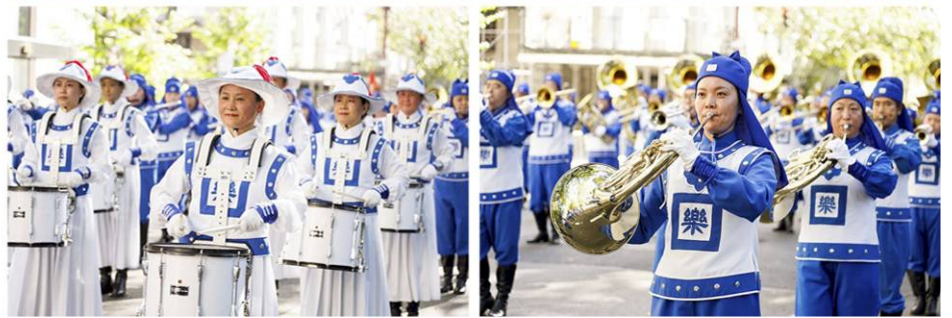
▲二零一九年十月十四日，由法轮功学员组成的纽约天国乐团参加了第七十五届纽约哥伦布日大游行（Columbus Day Parade）。