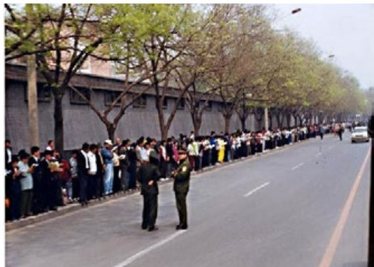
※ “4·25”上访现场。法轮功学员安静有序，警察在悠闲地聊天。