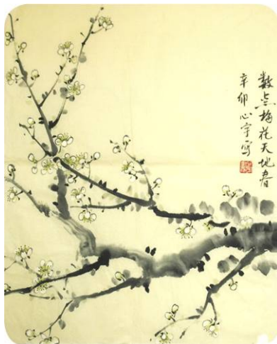
水墨画：数点梅花天地春

还有一个大法弟子把仅有的一盒饼干送给一个死刑犯，那个曾经在社会上混的、遇到刀枪都不眨眼的男儿，放风时路过女牢房时流下了眼泪说：“姐，这么多年我是第一次接到别人给我东西，以前都是别人从我这拿。我没进来前要是学了法轮大法，我不会犯罪，我会永远记住法轮大法好的。如果有来生我一定学大法。”后来他是一路上