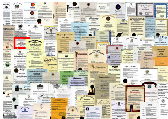
✿ 法轮大法获得各界褒奖、支持议案和支持信函 3600 多项。

北美、欧洲、亚洲、澳洲等地各级政府、议会，颁奖并高度推崇法轮功在提升道德、净化人心、强身健体与福国利民方面的卓越成果。