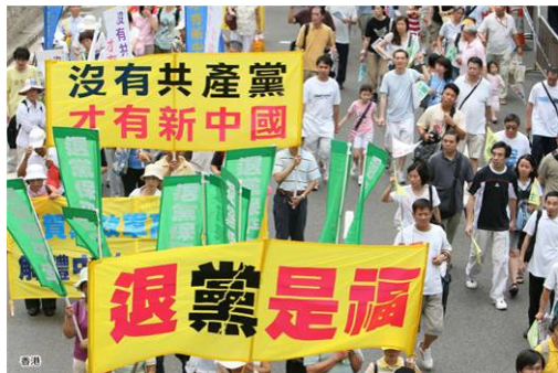
▲截至2019年9月退出中共邪党组织（党、团、队）总人数已突破3.4亿。图为海外华人游行中的退党横幅。

干完活临走的那天，书记不在，我问他妻子书记退党的事，她说翻墙看到外面的世界好惊奇啊，书记用真名退的，因他的名字是个大众化的名字，上网一查好多同名的人呢。她说，以后我们亲戚来，我们都给他们这样办理“三退”。我说：“恭喜你们三退保了未来平安。”◇