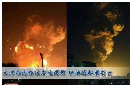
天津滨海新区发生爆炸 现场腾起蘑菇云

当人面临灾难而不自知时，一些奇怪的情况发生了，让一些人阴差阳错地躲过了灾难。下面这则故事就发生在中国大陆，当事人幸运地躲过了2015年的天津大爆炸。