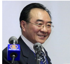
张凯臣，前沈阳市市委宣传部联络部长。