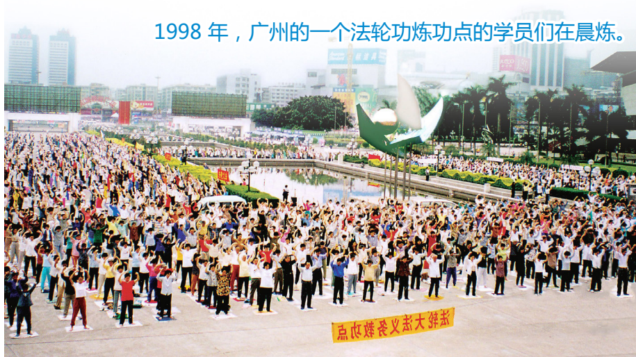
1998 年，广州的一个法轮功炼功点的学员们在晨炼。

法轮功自 1992 年 5 月 13 日由李洪志先生从中国长春传出，以简单明白的法理和祛病健身的奇效吸引了无数有识之士，至今已弘传世界 100 多个国家。李洪志先生和法轮大法因对人类身心健康做出的杰出贡献，获各国政府褒奖、支持议案、支持信函 3600 多项（上图）。