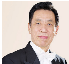
关贵敏，著名男高音歌唱家，中国“歌王”。