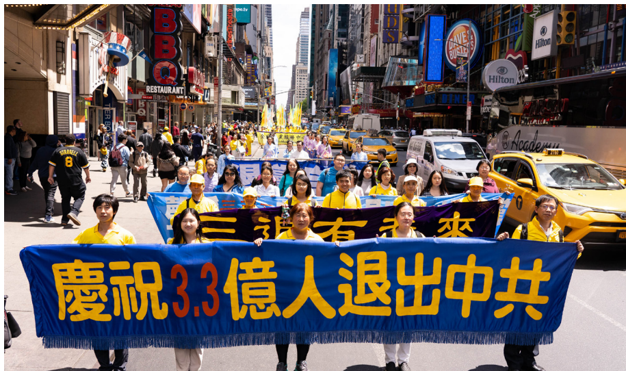
2019年5月16日，万名法轮功学员美国纽约大游行。

有人可能说“自己心中退党就算退了，不必声明”；还有人认为“自己多年没交党费了，就算自动退党了”；或者认为“年龄大了，已经自动退团、退队了”。但这都无法解除加入中共时发下的毒誓。而天灭中共时，没有解除这个毒誓的人，就将成为中共的陪葬。只有采取公开的方式退出，有行为的表示，才能解除那个“毒誓”。神看人心，只要真心声明“三退”，用真名、化名、小名皆可。