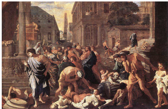
画家描绘的瘟疫（1630 年，法国画家 Nicolas Poussin）

公元 166 年，第二场大瘟疫降临了，史称“安东尼瘟疫”，横扫全国。史载罗马每天死 2000 人，16 年时间死了 500 万人，罗马帝国人口减少 1/3，君士坦丁堡死了一半人。