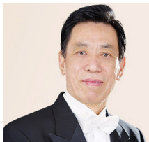
关贵敏，著名男 高音歌唱家，中国“歌 王”。