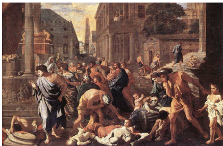
画家描绘的瘟疫（1630 年，法国画家 Nicolas Poussin）