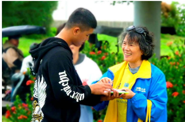
◀台湾法轮功学员在向游客讲法轮功真相。

一位从广州来游玩的大陆游客说：“不论到哪个国家游玩或出差，都会看到炼法轮功的人。”同时表示很钦佩法轮功学员们的精神。他还说：“希望快点平反法轮