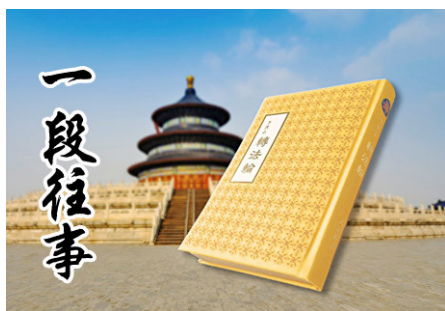
▲1999 年中共江泽民禁止法轮功书籍出版的禁令，已于 2011 年 3 月被废除。

领头的警察把头一摆，上来 4 个年轻警察，抢夺我手上的钥匙。我攥得紧紧的，他们掰不开我的手，就把我按倒在地，按腿的按