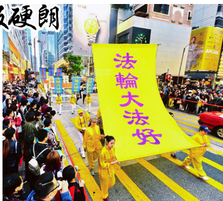
▲图为2016年1月2日香港法轮功学员新年大游行。大陆游客纷纷拿出手机、相机，争相拍照。

一天早上炼完功回家，我突然感到头部象抽筋、撕裂一样疼痛。想起师父讲过净化身体的现象，我明白了：这是师父在给我调整身体呢。很神奇，刚这样一想，只过了两、三分钟，疼痛就消失了。