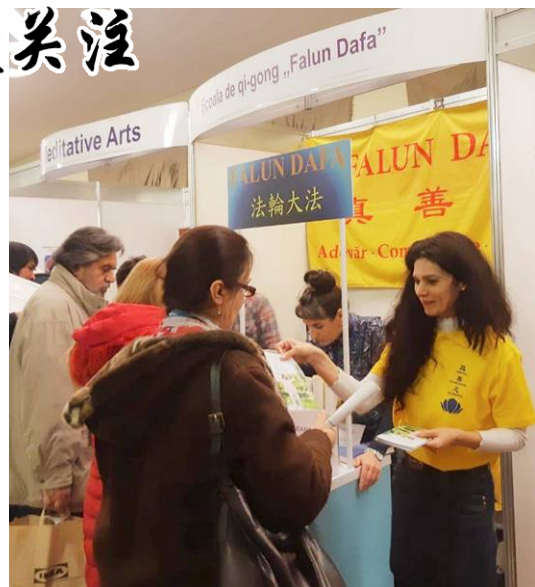
▲民众驻足法轮功真相摊位前了解法轮功

民众反馈，炼功时感受到祥和、宁静。一位女士表示，她感到学员们炼功时，有一种强大的能量场包围着她，她说自己一定要到炼功点跟大家一起学。很多人在看到功法展示后，特意去展位咨询怎样开始学炼、购买法轮功书籍，并了解法轮功被中共迫害的真相。整个3天的博览会，近万人拿到了法轮功资料。◇