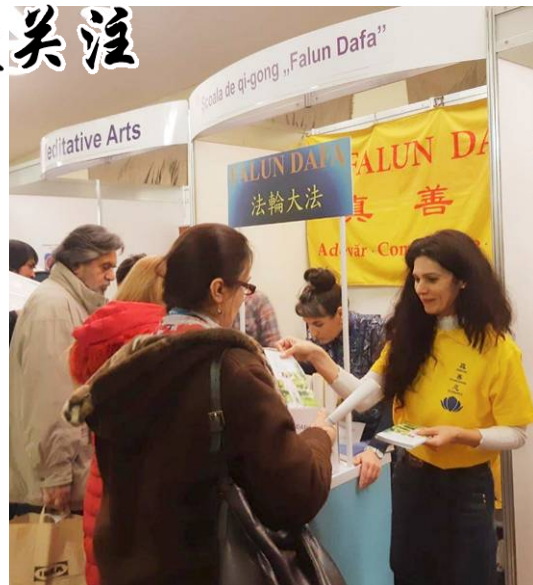
▲民众驻足法轮功真相摊位前了解法轮功

民众反馈，炼功时感受到祥和、宁静。一位女士表示，她感到学员们炼功时，有一种强大的能量场包围着她，她说自己一定要到炼功点跟大家一起学。很多人在看到功法展示后，特意去展位咨询怎样开始学炼、购买法轮功书籍，并了解法轮功被中共迫害的真相。整个3天的博览会，近万人拿到了法轮功资料。◇