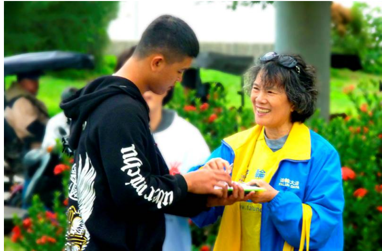
◀台湾法轮功学员在向游客讲法轮功真相。

一位从广州来游玩的大陆游客说：“不论到哪个国家游玩或出差，都会看到炼法轮功的人。”同时表示很钦佩法轮功学员们的精神。他还说：“希望快点平反法轮