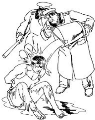
中共酷刑示意图：浇冰水