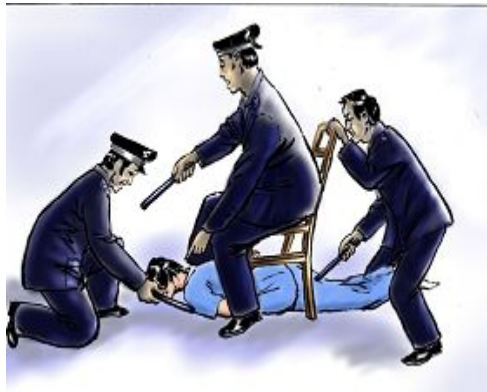
中共酷刑示意图：电击