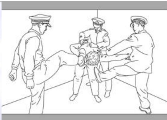
中共酷刑示意图：毒打