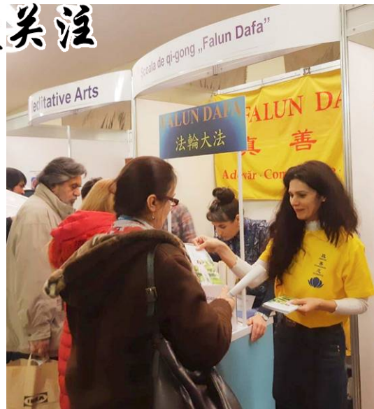
▲民众驻足法轮功真相摊位前了解法轮功

民众反馈，炼功时感受到祥和、宁静。一位女士表示，她感到学员们炼功时，有一种强大的能量场包围着她，她说自己一定要到炼功点跟大家一起学。很多人在看到功法展示后，特意去展位咨询怎样开始学炼、购买法轮功书籍，并了解法轮功被中共迫害的真相。整个3天的博览会，近万人拿到了法轮功资料。◇