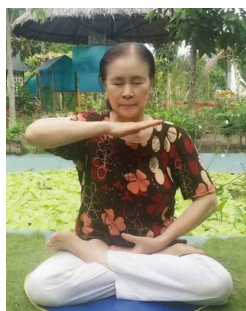
信仰合法 迫害有罪

众了解法轮大法好的真相,在邱家店镇某村,发送法轮功真相资料,并向路人讲述法轮功受迫害的真相,遭邱家店派出所警察绑架,被关到泰安市看守所。