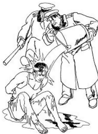
▲中共酷刑示意图：浇冰水

另一种水刑是冬天把衣服扒光后，让人站着或坐在地上，窗户都开着，再敞开门冻着，用水管长时间不停地往人头上盖骨的百汇穴部位浇凉水，开始感到异常寒冷，渐渐的感到脑袋麻木，后来逐渐的脑袋象要裂开了一样，脑浆崩裂般剧痛，痛在脑仁里面。这种