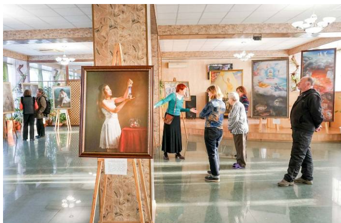
▲“真、善、忍国际美展”在俄罗斯五山城举行