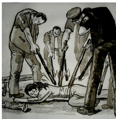
▲ 酷刑示意图：多根电棍电击

在禁闭室，警察时常以电警棍相威胁，把我按到床上灌食、输液，我的鼻子经常被捅出血。一个女警察凶残地叫嚣：“灌死她，把她扔到大烟筒里去”。警察时常对我拳打脚踢，往我嘴里塞擦例假的脏卫生纸，用木棍蘸上