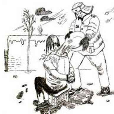
▲ 酷刑示意图：浇凉水

在一天黑夜，他们拿着复读机把我劫持到野外河滩的一个坟场，把我铐树上，戴上耳机迫使我听复读机里恐怖的鬼叫。一个小时后，见我毫无惧色，又说要把我扔到河里去，抓住我的头往水里按，边按边问改不改，我坚定地说：“法轮大法好！”他们就扯下一个树枝使劲抽打我。之后把我押回劳教所二楼，把棉衣扒掉只剩薄薄的内衣，打开电风扇吹着往身上浇凉水。