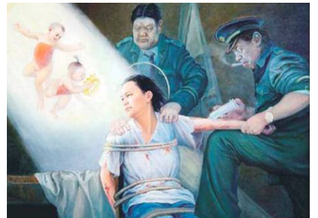
▲酷刑演示：打毒针（绘画）

织）对中国大陆15个省的100多家精神病医院（科）进行了调查，结果令人震惊。在被调查的对象中，明确承认“收治”法轮功修炼者的精神病院，占被调查精神病院（科）总数的83%，而且明确承认没有精神病症状只为“转化”而强行关押法轮功学员的精神病院则超过半数。被调查的医务工作者清楚，“收治”法轮功修炼者是在执行政治任务，有的精神科医务工作者竟把法轮功学员抵制酷刑洗脑，而不得已采取绝食抗议的和平行为作为诊断精神病和“收治”的标准之一，荒谬地把是否写“保证”放弃修炼法轮功作为评定“治疗效果”和出院的标准。