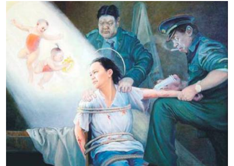
▲酷刑演示：打毒针（绘画）