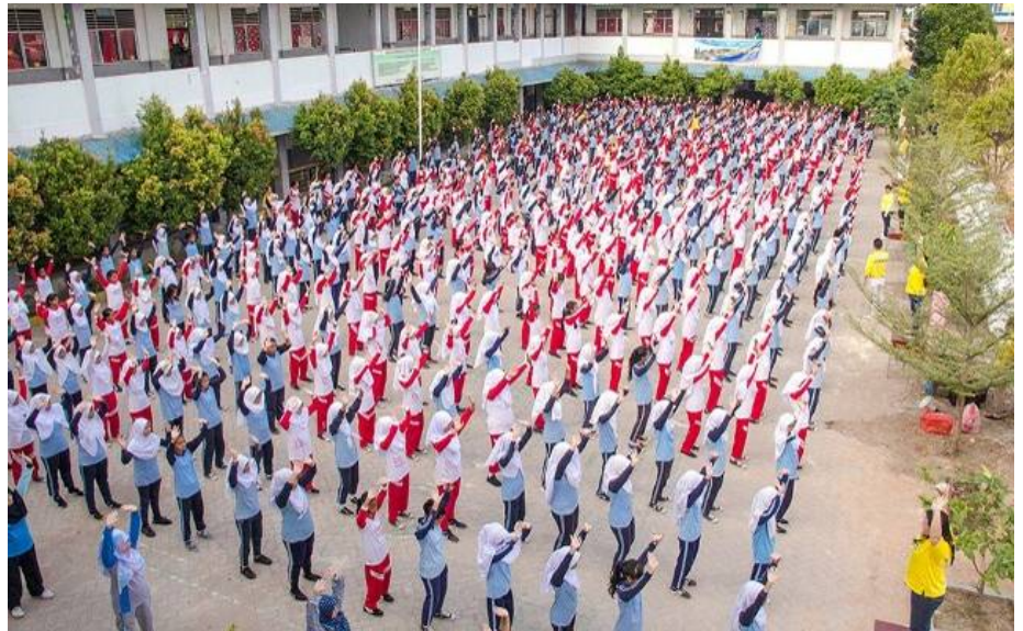
▲印尼巴丹岛第三十八国立中学大约五百名师生、工友集体学炼法轮功

炼完功后，校长表示：“音乐与动作能帮人集中注意力，身体部分特别是腰、关节、后背感到舒服。”艺术老师说：“当专注于音乐时，闭着眼感受到光。我的小臂受过伤，通常很难把它抬高，但在炼第四套功法时我能抬小臂过头，很奇妙！”◇