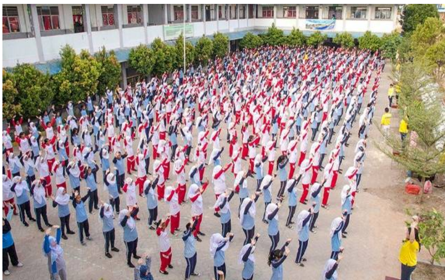
▲印尼巴丹岛第三十八国立中学大约五百名师生、工友集体学炼法轮功

炼完功后，校长表示：“音乐与动作能帮人集中注意力，身体部分特别是腰、关节、后背感到舒服。”艺术老师说：“当专注于音乐时，闭着眼感受到光。我的小臂受过伤，通常很难把它抬高，但在炼第四套功法时我能抬小臂过头，很奇妙！”◇