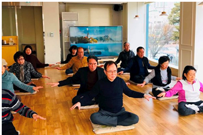
▲韩国天梯书店里，新学员在学炼法轮功第五套功法

一天早晨，他在富平公园里运动，看到一名女法轮功学员独自在炼功。“从那里我感受到了很强烈的能量，同时，感到她的炼功动作比跳舞还