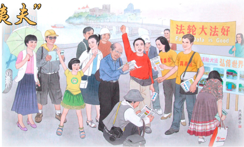
◀绘画： 明白真相的人们高呼 “法轮大法好”