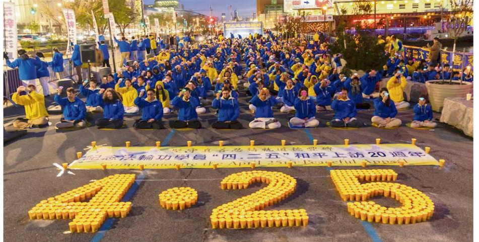
▲ 2019 年 4 月 20 日傍晚，法轮功学员在纽约中领馆前举行烛光夜悼。学员们手捧莲花灯，神情肃穆，默默哀悼被中共迫害致死的同修。

“许多人认为，如果没有发生万人大上访，就不会导致中共迫害，果真如此吗？”石采东说，没有“四二五”上访，中共反人类的本质亦决定了它会发起迫害，一九九九年中国有一亿人在学炼法轮