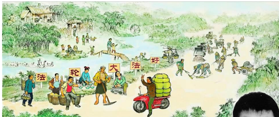
▲绘画：法轮功学员出钱出力，义务为村民修路。