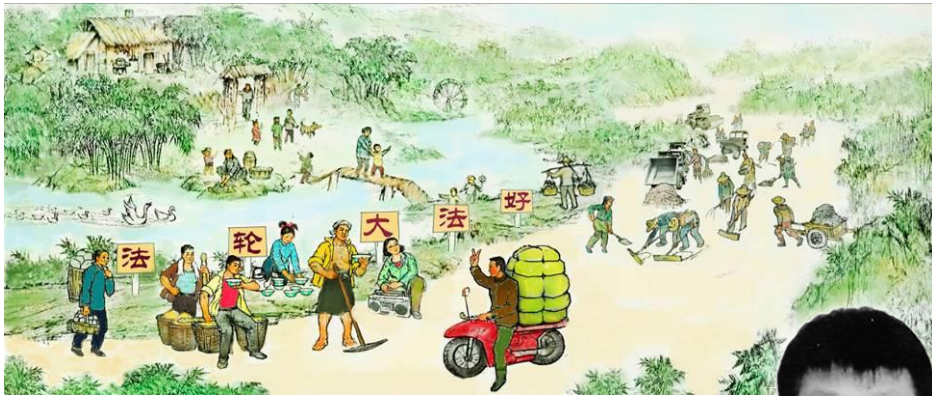
▲绘画：法轮功学员出钱出力，义务为村民修路。 乡亲们说：“都像炼法轮功的这社会就好了。”