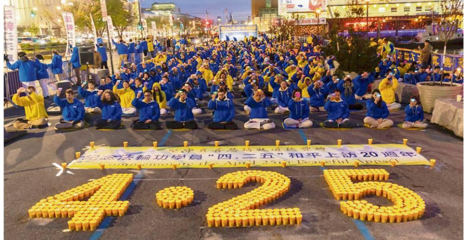
▲ 2019 年 4 月 20 日傍晚，法轮功学员在纽约中领馆前举行烛光夜悼。学员们手捧莲花灯，神情肃穆，默默哀悼被中共迫害致死的同修。

“许多人认为，如果没有发生万人大上访，就不会导致中共迫害，果真如此吗？”石采东说，没有“四二五”上访，中共反人类的本质亦决定了它会发起迫害，一九九九年中国有一亿人在学炼法轮