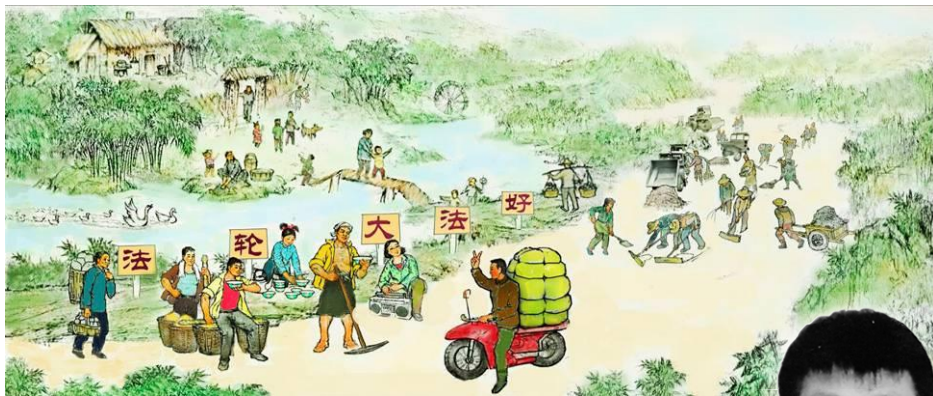
▲绘画：法轮功学员出钱出力，义务为村民修路。