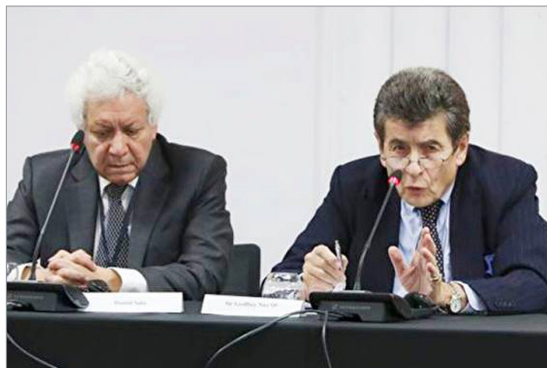
伦敦独立人民法庭主席尼斯爵士（图右）