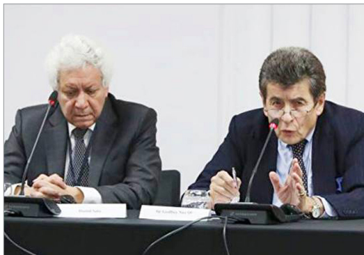
伦敦独立人民法庭主席尼斯爵士（图右）