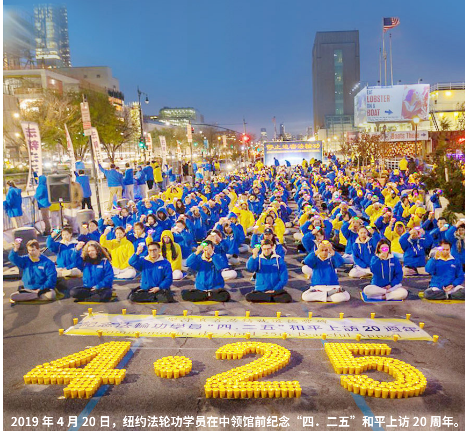
2019 年 4 月 20 日，纽约法轮功学员在中领馆前纪念“四·二五”和平上访 20 周年。

1999 年 4 月 25 日，万名中国法轮功学员为了维护对“真善忍”的信仰到国务院信访局和平上访，法轮功学员展现出的崇高道德操守和非凡勇气，令世界瞩目，成为时代典范。20 年来，法轮功真相传遍世界，越来越多的人摆脱中共谎言欺骗，走向美好未来。