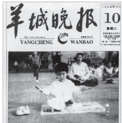
《羊城晚报》：老少皆炼法轮功 (1998年11月10日)

1998年9月，由医学专家组成的小组为配合此次调查，对广东12553名法轮功学员进行表格抽样调查，结果显