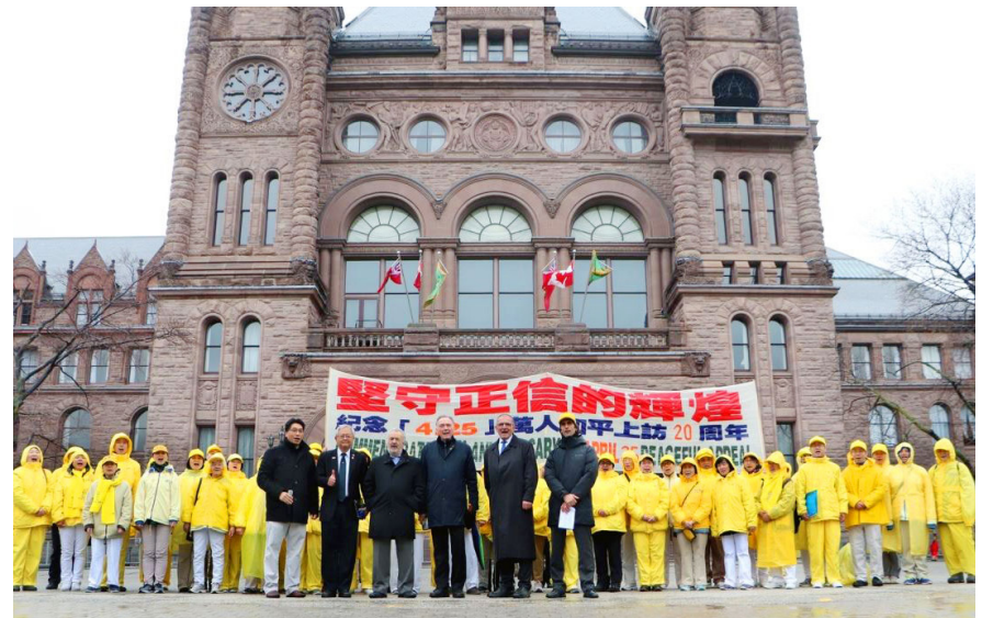
加拿大安省议会大厦前，多伦多法轮功学员举行纪念“四·二五”20周年活动。几位加拿大政要冒雨来现场支持，并欢呼：“法轮大法好！”（2019年4月20日）